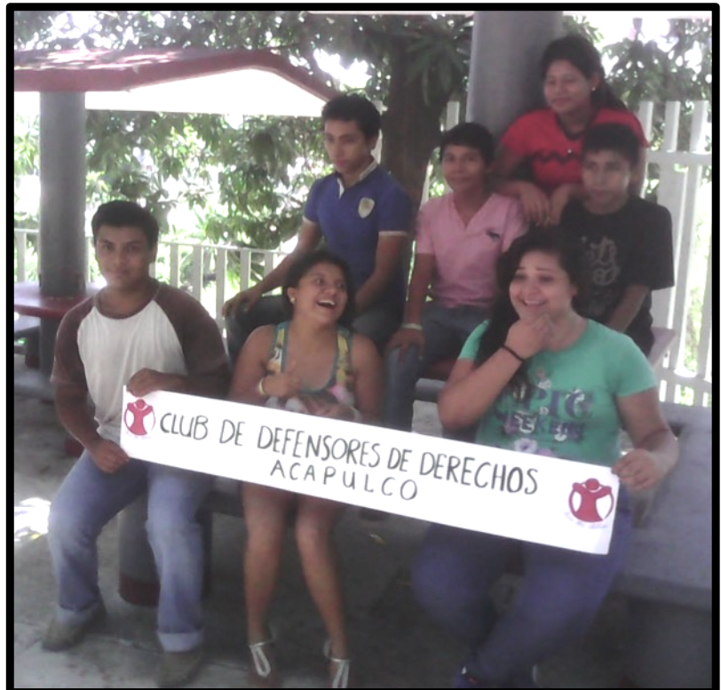
Jóvenes participantes en el programa de Escuelas Construyendo Paz Acapulco, Guerrero, 2015